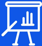
ارزش شرکت و خوارزم - میلیارد ریال